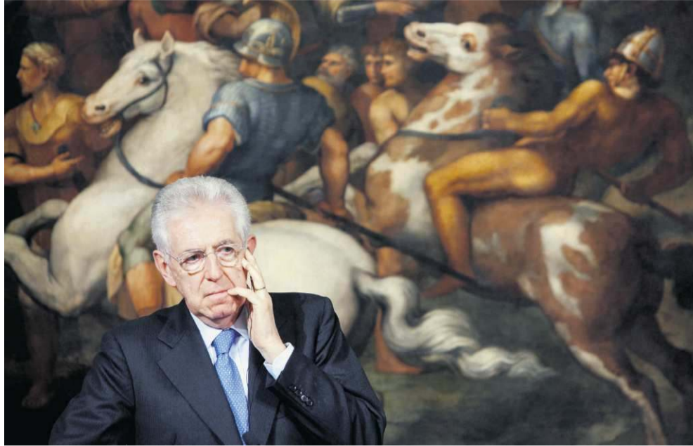
Italiaanse premier Monti in het Chigi Paleis in Rome, 13 maart j.l.

Hoe heeft dat zo snel kunnen gebeuren? Dat hij als politicus wat knullig campagne voerde