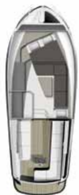
Lounge met Dubbel bed