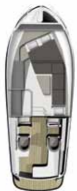
Comfort met Dubbel bed