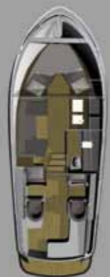
Comfort met V bed