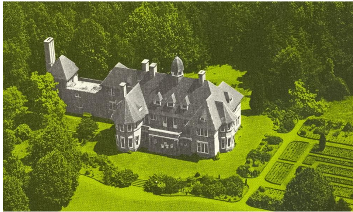
Zonnewende vóór de uitbreiding aan de noordzijde. Links op de foto het ketelhuis. Ten behoeve van de uitbreiding is het ketelhuis gesloopt.

Karel de Bazel was een tijdgenoot van architect Hendrik Berlage en hoewel Berlage meer bekendheid geniet, kan De Bazel zeker op gelijkwaardig niveau gesteld worden.