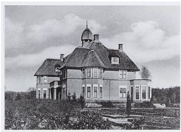
Zonnewende uit de beginjaren, met rieten kap. Het rijzige karakter wordt extra versterkt door het toen nog lege landschap.

In deze periode (vanaf 1906) bouwt hij veel landelijke villa's in een eigen versie van de Engelse landhuisstijl. Zonnewende is hiervan een goed voorbeeld. Uiterlijke kenmerken van deze stijl zijn symmetrisch opgezette plattegronden met hoog opgaande gevels en steile, meestal rieten, kappen en een torentje of lantaarntje als bekroning op de middenpartij.