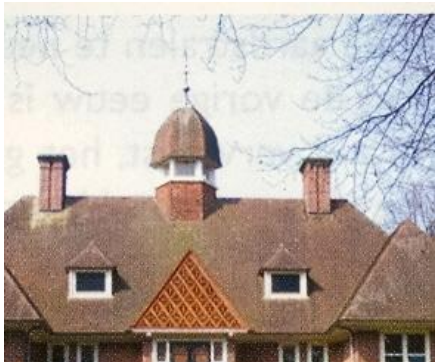
Overeenkomst in vormtaal op macro-/ en microniveau

Onder invloed van zijn levensbeschouwelijke opvattingen streefde De Bazel in zijn werk naar geometrie en harmonieuze verhoudingen, gebaseerd op wiskundige ontwerpsystemen. Hij liet zich inspireren door voornamelijk klassieke oosterse vormen. Wat De Bazel ontwierp op microniveau, (meubels, ornamenten, interieurs, glas grafiek) bracht hij meer en meer ook over op macroniveau (gebouwen).